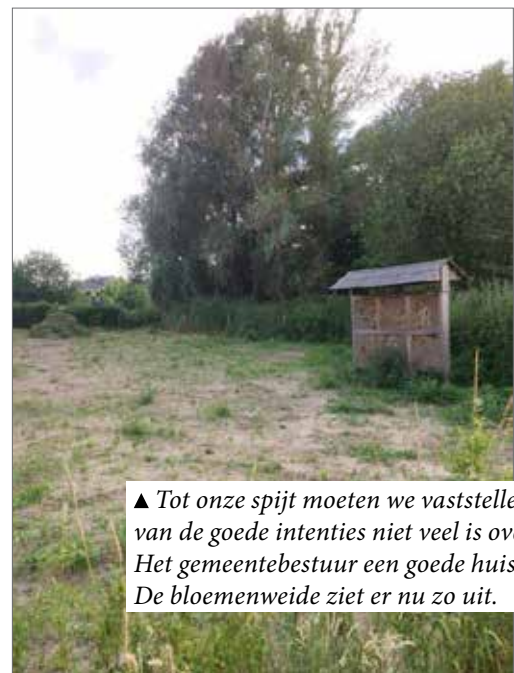
▲ Tot onze spijt moeten we vaststellen dat er van de goede intenties niet veel is overgebleven. Het gemeentebestuur een goede huisvader? De bloemenweide ziet er nu zo uit.

Het gemeentebestuur nam de actie over. In instroom van 2014 konden we lezen: 'Daarom wordt in het voorjaar van 2015 een vaste bloemenweide ingezaaid aan de ingang van de Bergenmeersen ter hoogte van het kerkhof van Wichelen. En om het de bijen nóg aangenamer te maken wordt er ook een groot insectenhotel geplaatst. Wij nodigen u uit om de bloemenweide te komen bezichtigen in de zomer van 2015!'