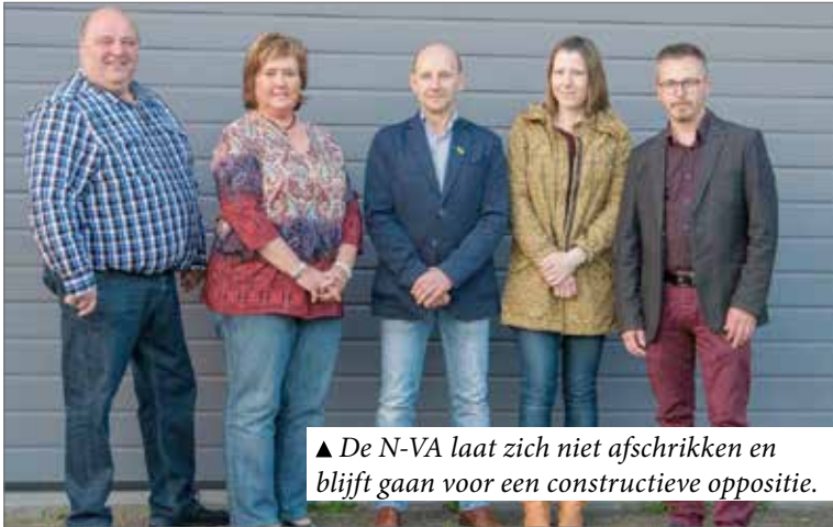
▲ De N-VA laat zich niet afschrikken en blijft gaan voor een constructieve oppositie.