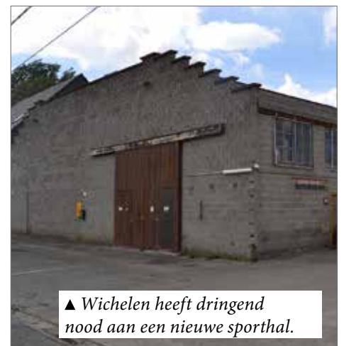
▲ Wichelen heeft dringend nood aan een nieuwe sporthal.

Maar wie een andere sport wil beoefenen (volleybal, basketbal, judo, zaalvoetbal, tennis, karate, dans ...) vindt in de eigen gemeente geen fatsoenlijke sporthal. Intussen worden er in onze buurgemeente wel extra sporthallen gebouwd, maar ook