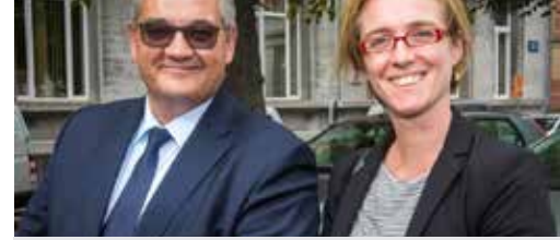
Bestuursleden in de kijker p. 3