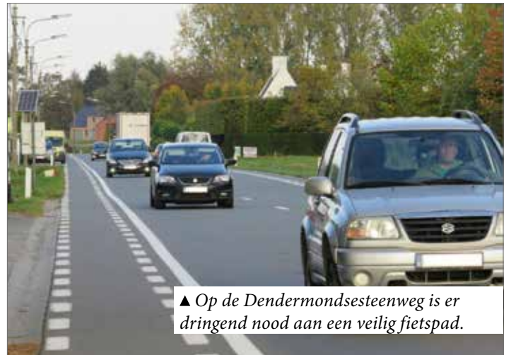
▲ Op de Dendermondsesteenweg is er dringend nood aan een veilig fietspad.

Ondertussen is er vanuit de provincie een project opgestart om naast de spoorweg (kant Bruinbeke/ Serskamp) een fietssnelweg aan te leggen tussen Wetteren en Dendermonde. De kosten hiervoor worden, op eventuele onteigening van gronden na, door de provincie gedragen. Dat project staat nog in de startblokken en