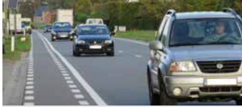
Verkeersveiligheid aan Dendermondsesteenweg p. 2