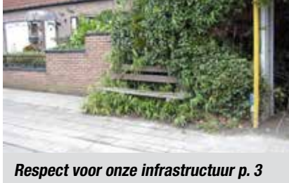
Respect voor onze infrastructuur p. 3